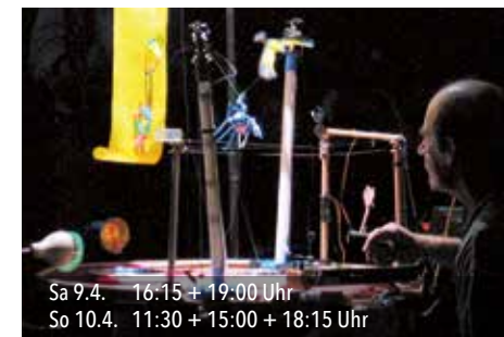
Sa 9.4. 16:15 + 19:00 Uhr So 10.4. 11:30 + 15:00 + 18:15 Uhr

Eine Entdeckungstour durch den Backstagebereich von Kampnagel mit drei ganz besonderen Konzerten. Nicht verpassen. Uraufführung! Nur wenige Karten!