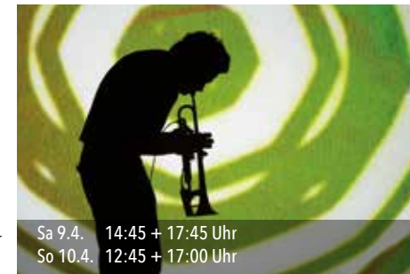
Sa 9.4. 14:45 + 17:45 Uhr So 10.4. 12:45 + 17:00 Uhr

Hier wird die Musik von Miles Davis lebendig. Szenen aus seinem Leben gehören dazu. Für seine Liebe zum Boxen steht ein Punchingball, der – mit Eurer Hilfe – die Band dirigiert.