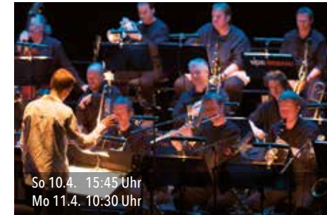
So 10.4. 15:45 Uhr Mo 11.4. 10:30 Uhr

Ein Konzert für Klavier und digitale Malerei. Vier Hände. Jazzige Klänge und sich ständig verwandelnde Bilder. Der Dialog zweier faszinierender Künstler.