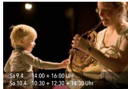
Sa 9.4. 14:00 + 16:00 Uhr So 10.4. 10:30 + 12:30 + 14:30 Uhr

Ein Musikspielplatz, in dem die Aller kleinsten spielen, Klänge entdecken und musizieren können. Es gibt ein Nest, eine Bambushütte, einen Tunnel, Leitern und natürlich die wunderbaren belgischen Musiker.