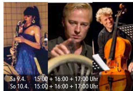
Sa 9.4. 15:00 + 16:00 + 17:00 Uhr So 10.4. 15:00 + 16:00 + 17:00 Uhr

Drei Musiker liefern eine explosive, dynamische Show. Sie begegnen sich musikalisch und tragen mit wilden Rhythmen ihre Konflikte aus: viel Vergnügen – Bodypercussion auf höchstem Niveau!