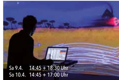
Sa 9.4. 14:45 + 18:30 Uhr So 10.4. 14:45 + 17:00 Uhr

Das Klingende Museum lädt Euch in das Alabama Kino ein. Dort könnt Ihr Geigen, Posaunen und vielen anderen Instrumenten Eure ganz eigenen Klänge entlocken!