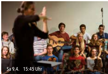
Sa 9.4. 15:45 Uhr