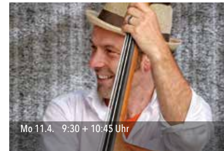
Mo 11.4. 9:30 + 10:45 Uhr

Dr. Sound (Elbphilharmonie Kompass) macht auf dem Flughafen eine klangvolle Entdeckung: Er hat die Sound-Kopiermaschine des Mafia-Bosses aufgespürt!