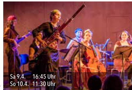
Sa 9.4. 16:45 Uhr So 10.4. 11:30 Uhr

Elf Wiener Musiker vergnügen sich und Euch mit Musik von Xenakis, Aperghis, Zappa und anderen. Eine Riesenband nimmt Euch mit auf eine witzige Reise durch die Neue Musik! Dirigent: Daniel Riegler