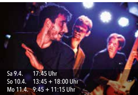
Sa 9.4. 17:45 Uhr So 10.4. 13:45 + 18:00 Uhr Mo 11.4. 9:45 + 11:15 Uhr

Soleo Association Braslavie (F) Mindestalter 6 Jahre